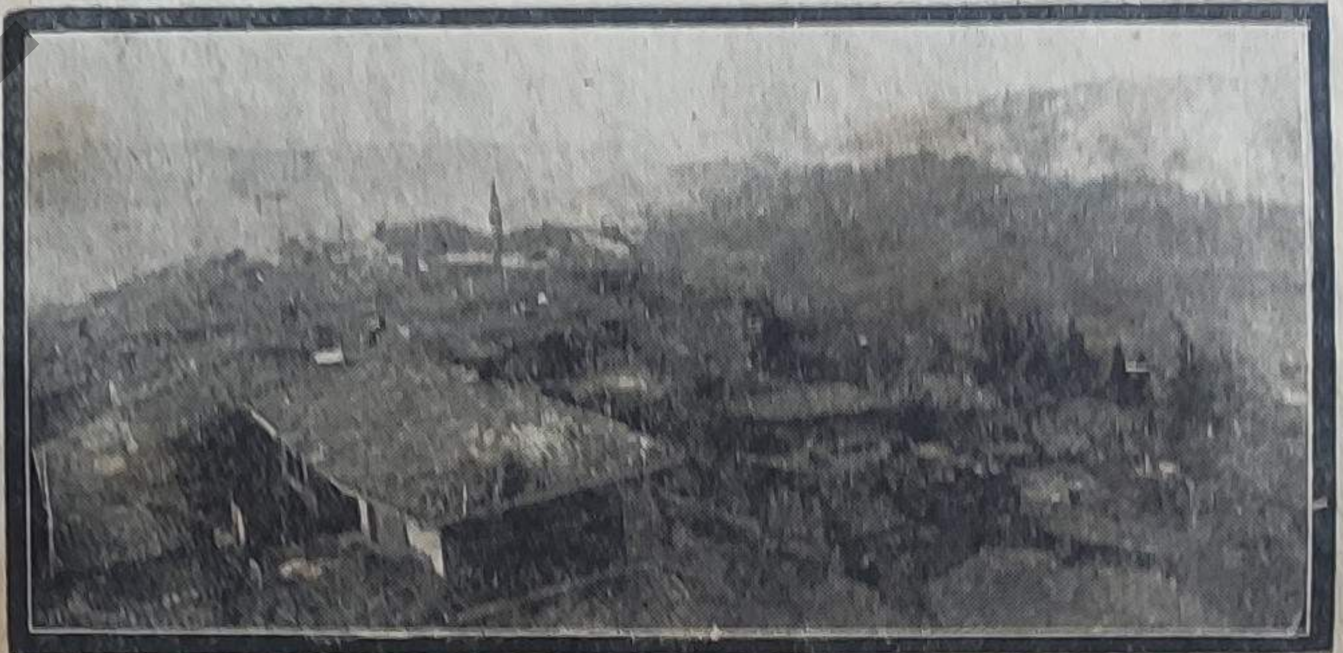
دكزي و لاينك بري بيكره فضله نفوس مالك نايميسي : قاضي كوي ، ده به منظره

قدادار ، موسيقي به يك مرقا اولوب هر هانكي بر شرفي بر دغه ديكلسه غرامفون يلاق كي كفسيه ، بته سيه ضبط ايدر ، بر داها اونوماز . و بونون آلات موسيقي و ملقا تكيله رده اولبه بايلان ذكرلري عييله تقليدايدر . قدادارله قونوشان بر انسان ايجون كوله مك قابل دكلدر . مع مانيه قدادار ابراهيم بوله مجنوب طاعنه برابر معيشتي تأمين ايجون دائما چاليشير