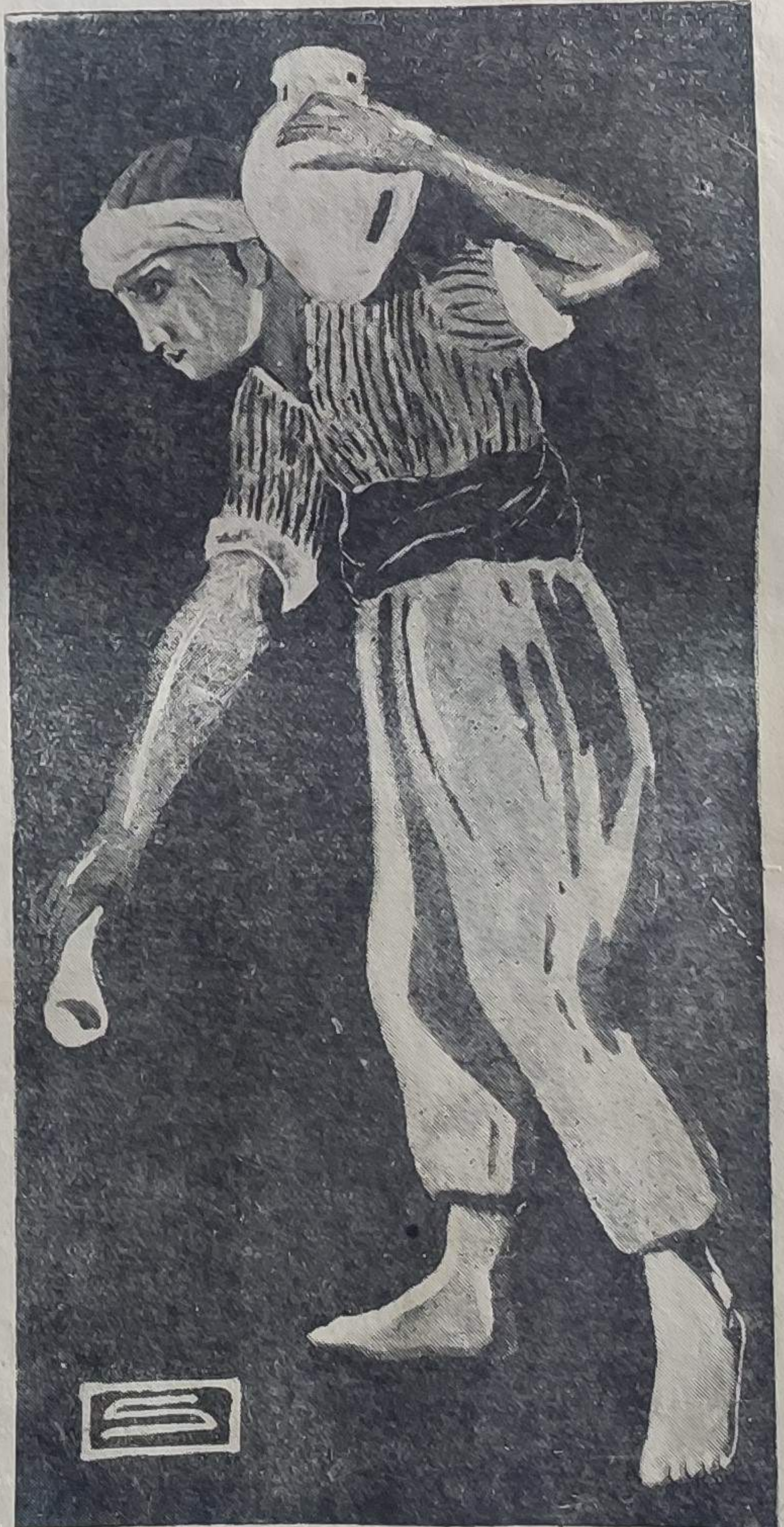
« آیین جم » میدانه ساقی!...

هو دیلم قبول اولسون دیله کلر کوک یوزنده پرواز ایدر ملکلر صوف میدانه اقرار ویره نلر میدانی کوروب عشقله کیره نلر میدانه کولکن یره سره نلر حقدر بیئلر کرچک آره نلر .. بو ابلك دوره (تک لهماه) دیرلر. باکره لرک ده وریم ده وریم کیریکلرک آلتنده کی قاب قازا کوزلری عمورلاشیر، اطراف قیزلر .. و کوزله قیزلرک یاغین باقیلری، جامع اولورلرک مونس قوسورلری کی ده لیقانیلرک او زرنده دولاشیر .. تام بوسبرده، سید، یاننده کی یشیل طور بادن (سردسته) بی چیقاریر. هرکس آیاغه قالمار، ده کنه تک آلتدن کهر. سوکرا کلیرلر . تکرر تکرر سرده سته بی اوپرلر .. سوکرا ینه یرلرینه اوطورورلر . ذا کرلرک کوزله سسی، مجلسی غشی ایچنده، وجد ایچنده بر اقیه: