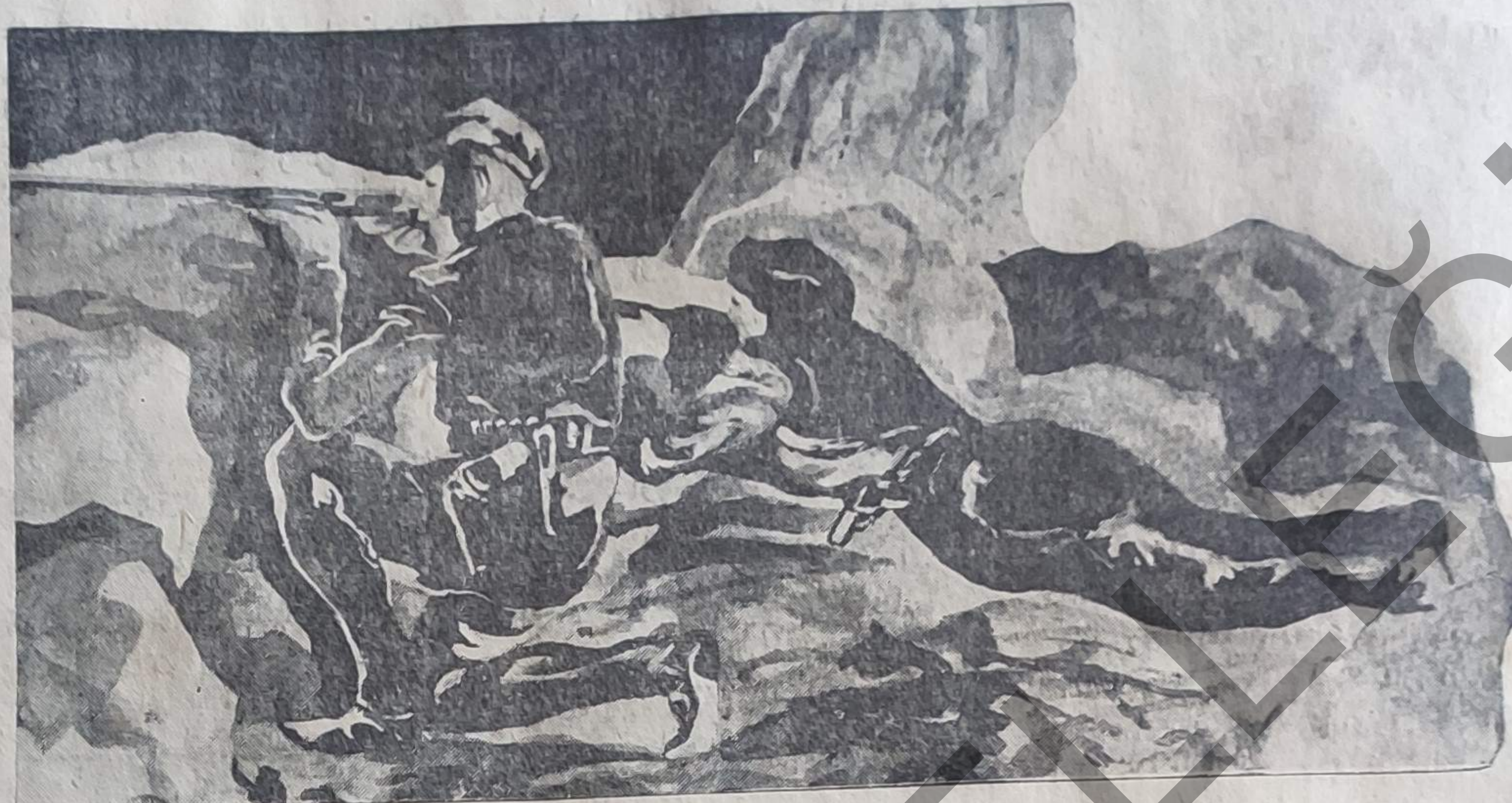
رجب رىشك اوشاقلىرى، شىمدى دىكك اوستىدەكى قارالتىر قورشون باغىرىپتۇردى

قورشون ياغمورى باشلامىدى، فرانسز مخربى حقيقتتە هووا دىھىشتلى تىزىلمە كىرىپتۇردى، نىزابت موفىقتە حاصل اولدى: پروژە كۆرۈنەر باھالانمىدى!