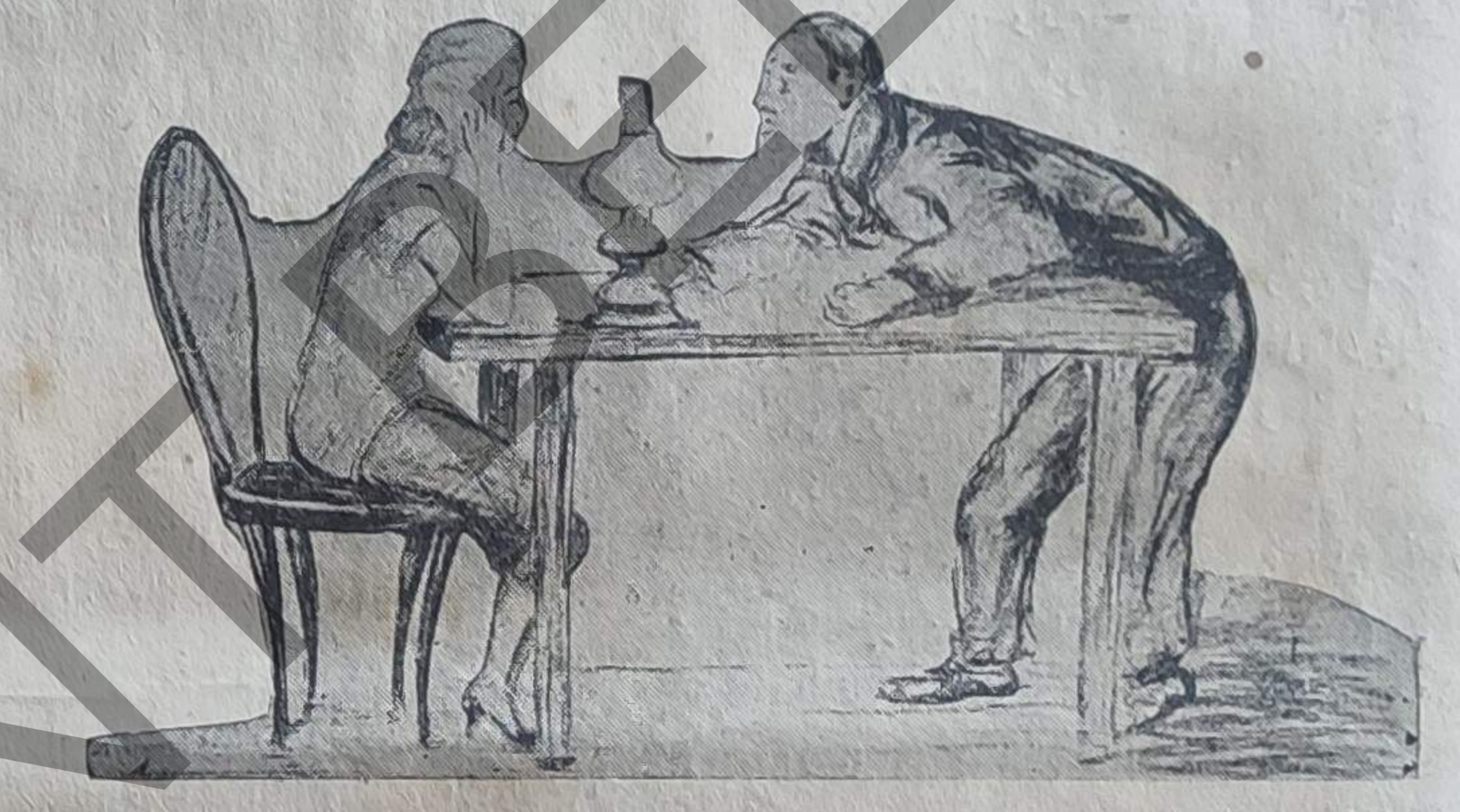
بی ده فصد کیتدم، فقط اسکیره آنجه میخدم واری

مکره، به باقانه... تام آلتی هفته قاریک بوملمککی دوام ایندی. صوکره لری یاواش یاواش خونی ده کیشمکه باشلادی. اوک ایچی بیلکدن کورون اولدی.