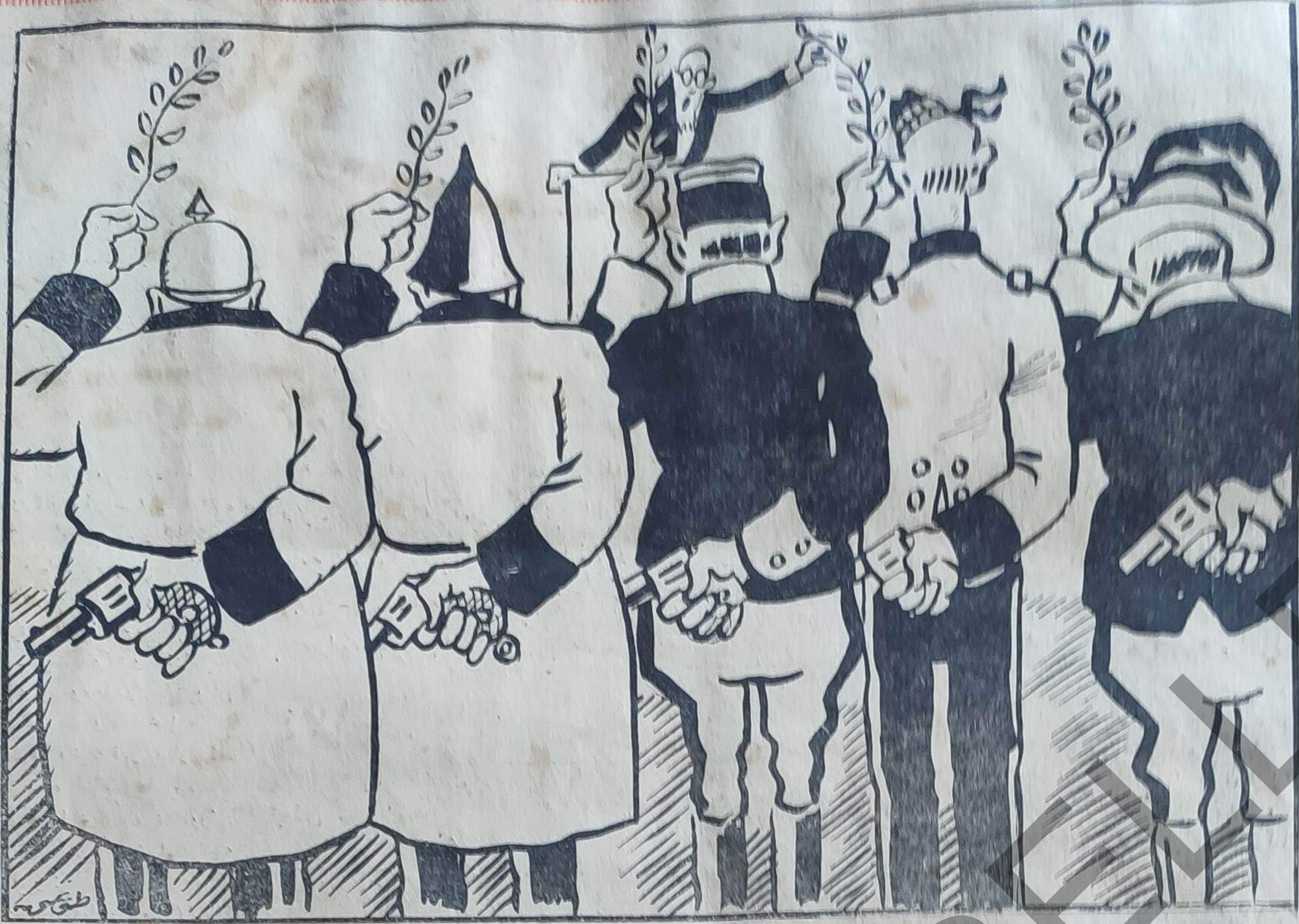
مجموعه دولتر (برائیدن) - همزده تمديد سلاحه طرفدارز ، فقط الارضده كي سلاحه دو فونيلما دغه ...