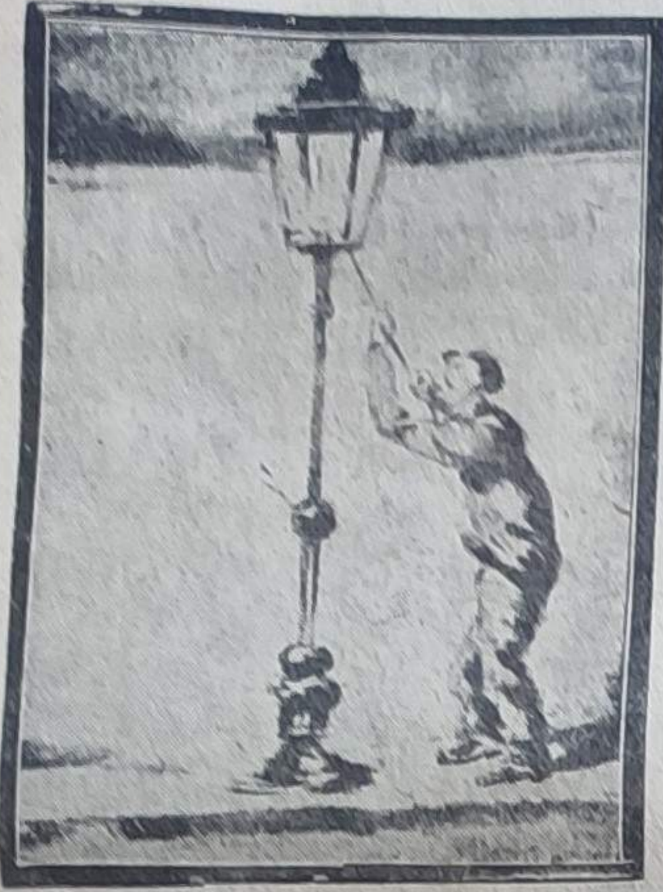
شهرامیننده، دکن آبرال مخرمنده...

کلوبه کورده... اداره لامبسانک تیره کوماری ضایع قارشینده سیاه بر جسم طاواندن آشانی صارقیوری؟ فورقودن، دهشتدن «آمانک آدوستلر... جان قورنازان یوقی؟» دیه دیشاری فرلامش. کندیسنی تکرار شوق بک اوند بولم. بائلم اختیار، او ساعته بکجی فلان آله کیمرکده مشکل... شوق بک اوغلی مقبل بکی آلم، اوه کلام. زوالی فوجم حالا اولدینی برده سالانیوردی.