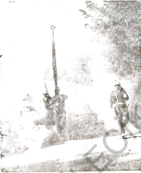
Kahraman Türk askerinin en büyük bayramı 30 Ağustos kutlanırken, Mehmetçik geçit töreninde görülüyor.